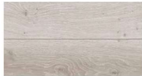
ホワイトオークF ★のお部屋