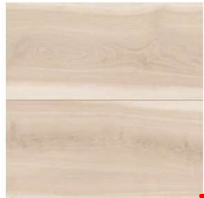
ワイドローズチェリーF (ラシッサ Dフロア)