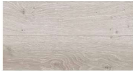
ホワイトオークF ★のお部屋