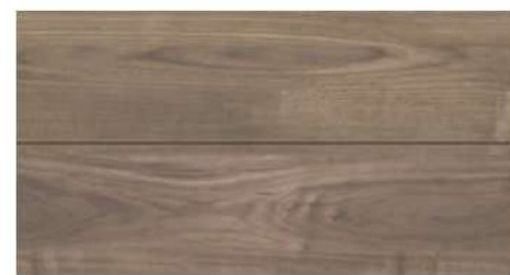
ウォールナットF ★のお部屋